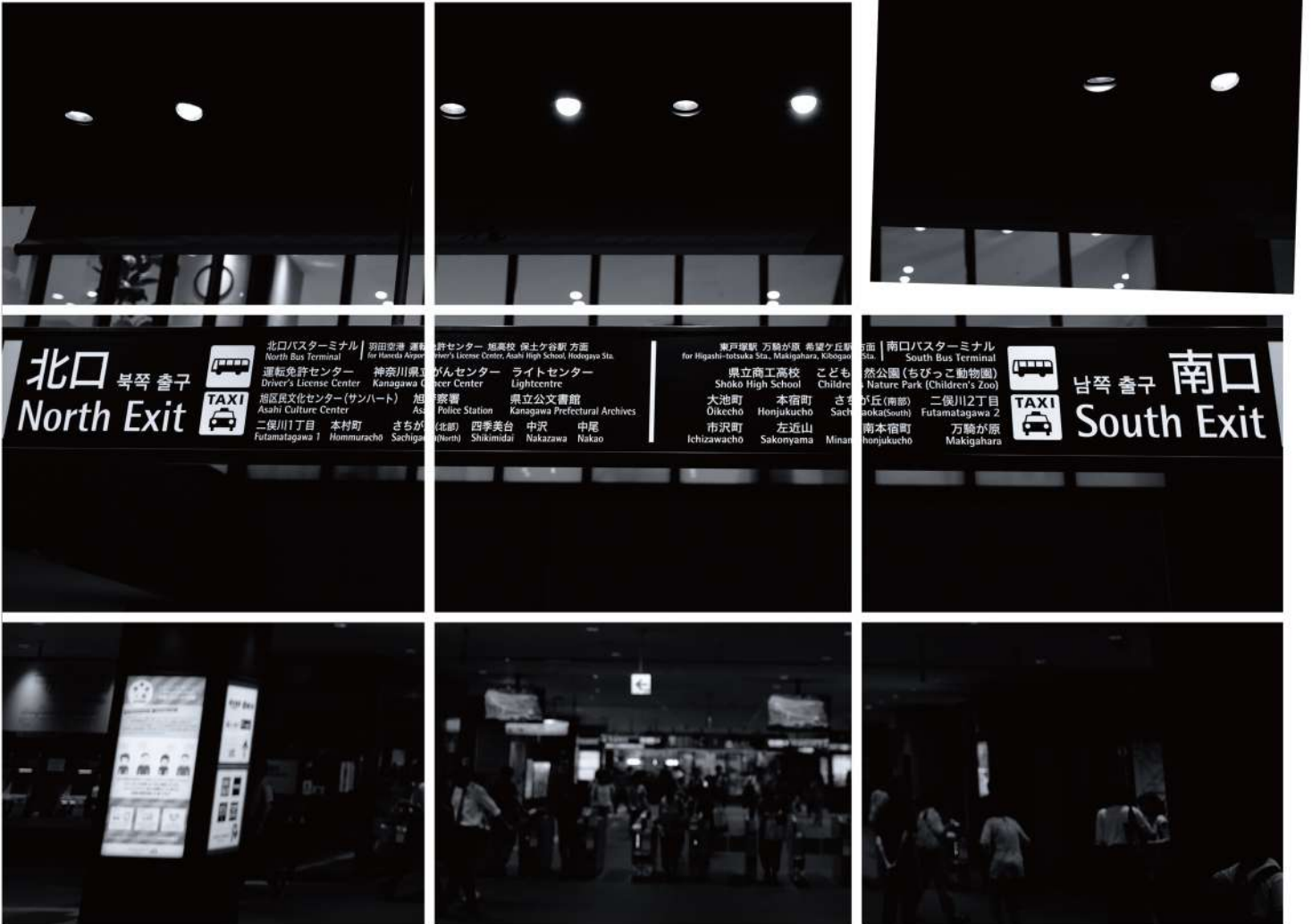
写真：相鉄線二俣川駅改札

DARUMAGAZINEは(株)だるま商事不動産が年4回 製作・発行する 二俣川エリアにフォーカスしたフリーペーパーです