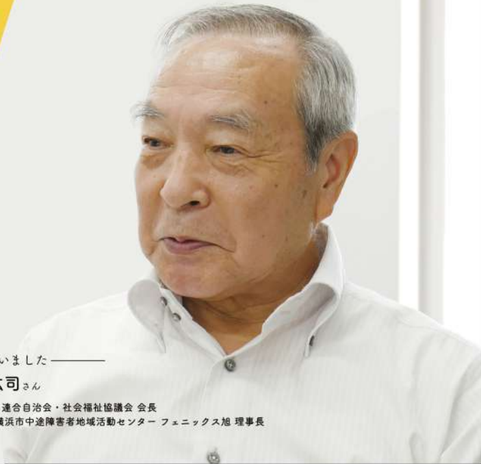
お話を伺いました——